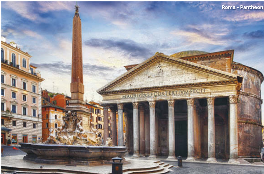
Roma - Pantheon