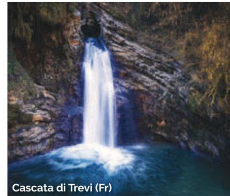
Cascata di Trevi (Fr)