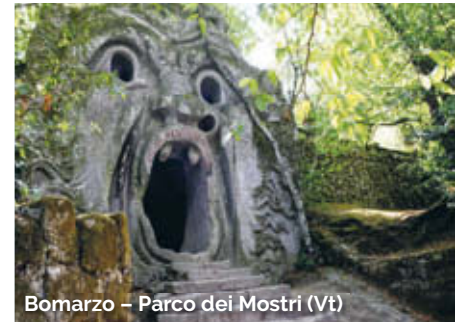
Bomzarzo - Parco dei Mostri (Vt)